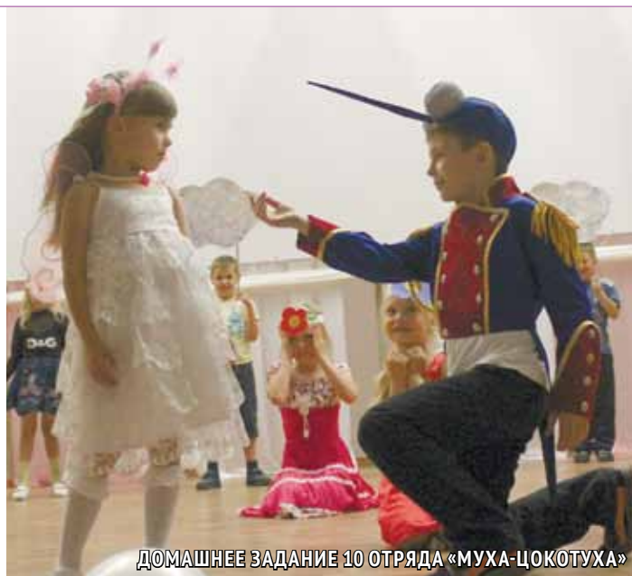
ДОМАШНЕЕ ЗАДАНИЕ 10 ОТРЯДА «МУХА-ЦОКОТУХА»