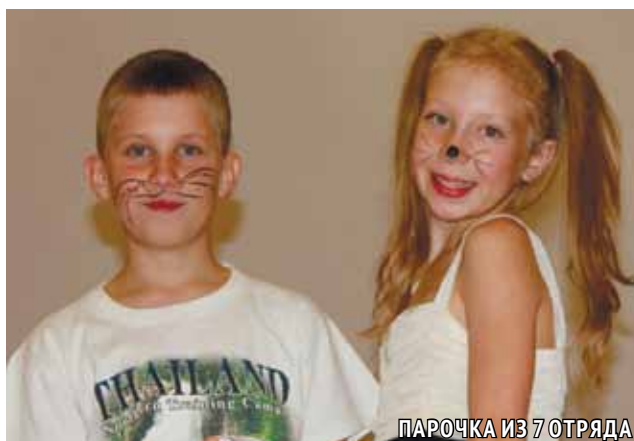
ПАРОЧКА ИЗ 7 ОТРЯДА