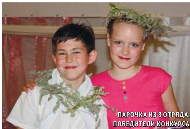
ПАРОЧКА ИЗ 8 ОТРЯДА. ПОБЕДИТЕЛИ КОНКУРСА