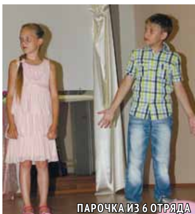
ПАРОЧКА ИЗ 6 ОТРЯДА