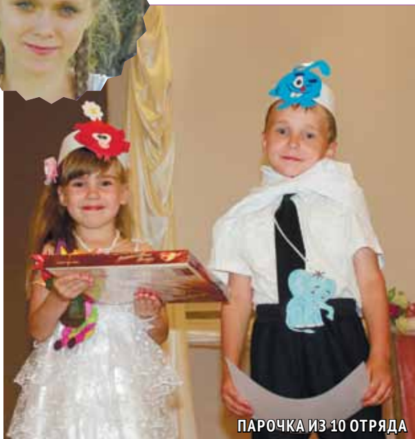
ПАРОЧКА ИЗ 10 ОТРЯДА